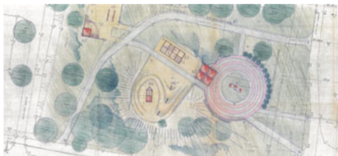
Návrh, podle kterého byl park Řehořova zbudován v letech 1992–1993.

Za tu dobu zažil park Řehořova několik změn. Obměnily se herní prvky, opravil se chodník, zbudovalo nové osvětlení a kamerový systém a částečně se změnila i zeleň. Některé úpravy však nerespektovaly původní projekt, což ovlivnilo charakter parku. Z tehdejších vysazených dřevin se do dnešního dne dochovaly pouze 3 stromy a několik keřů, které však již byly ve špatném stavu. Většina stromů nacházejících se v parku byla vysazena nebo se vysemenila dlouho před rokem 1992. U řady z nich se začaly objevovat zdravotní problémy, které bylo nutné řešit. Rovněž chodníky si vyžadovaly opravu. Kamerový systém byl nefunkční a některé herní prvky si zasloužily opravu nebo úplnou výměnu. Z těchto důvodů se radnice rozhodla pro kompletní rekonstrukci parku. Pro tento účel si nechala vytvořit 3 návrhy, z nichž byl vybrán projekt Ing. Evy Wagnerové. K projektu se vyjadřovala stavební komise, jejíž členem byl rovněž Ing. arch. Michal Říčný. K projektu se mohli na prezentaci v květnu