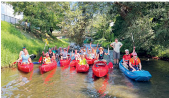
Svitavou NAFEST – plavba lodí z Bílovic nad Svitavou až na festivalové Černovické nábřeží.

Oběma směry jsme se vydali při 9. ročníku festivalu na nábřeží Svitavy Překročíme řeku. Festival propojuje oba břehy řeky napříč Brnem od Obřan až po Tuřany. Na dvacítce stanovišť čekaly na návštěvníky koncerty, divadlo, výtvarné dílny, nejrůznější spor-